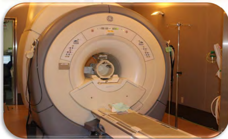
↑ MRI 室