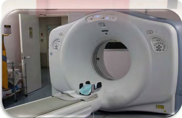
↑ CT 室